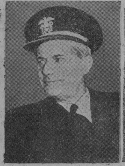
Jerauld Wright, comandante en jefe de la flota de la O. T. A. N. que ha advertido contra el interés cada vez mayor que demuestran los submarinos rusos por las costas norteamericanas y canadienses

La crónica concluye diciendo que hay españoles que estiman que España puede ser capaz en unos años de adherirse al Mercado Común Europeo e incluso a una organización más vasta que pudiera suceder a éste.—Efe.