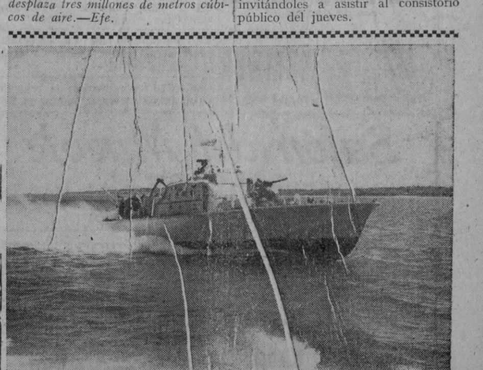
La "Erave Borderer", primera de una nueva clase de embarcaciones rápidas de patrulla para la Armada británica. Durante las pruebas—propulsada por turbinas de gas—desarrolló más de cincuenta nudos, por lo que se cree es la más rápida embarcación de guerra del mundo

El globo, sin tripulantes, mide ciento cincuenta metros de longitud por ciento de diámetro. Puede alcanzar una altura de cuarenta mil metros y desplaza tres millones de metros cúbicos de aire.—Efe.