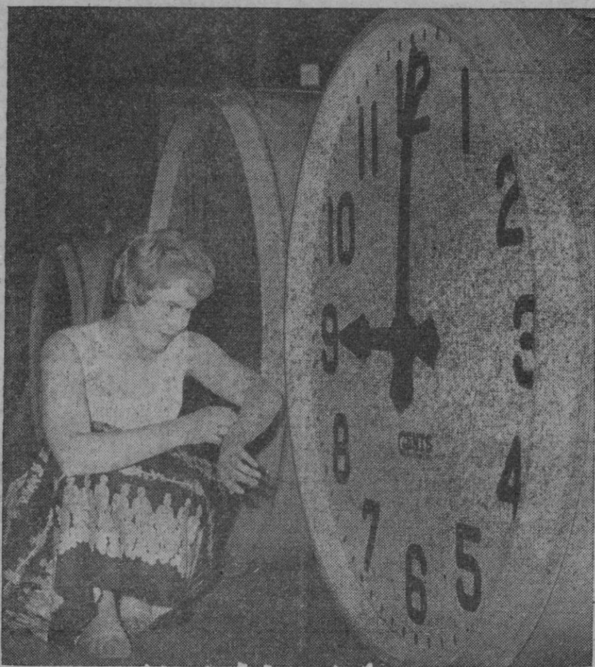
Los relojes gigantes que sirven, en una fábrica de Leicester, para comprobar la hora de un reloj de pulsera, de señora, poco antes de que fueran desechados con destino a la central eléctrica de Kariba, Rodesia Meridional, donde comprobarán el número correcto de ciclos por segundo de la corriente alterna. Para ello se compara la hora indicada por el reloj que funciona con la red de distribución—cuya marcha está regulada por la periodicidad de la corriente suministrada—con la hora "standard" que proporciona un reloj de péndulo de gran precisión.

En la Alcaldía de Villanueva del Río y Minas, se ha recibido un telegrama del vicario general del arzobispado, en el que se ofrece la condolencia del cardenal-arzobispo de Sevilla y se informa que se dispone la celebración de funerales.—Cifra.