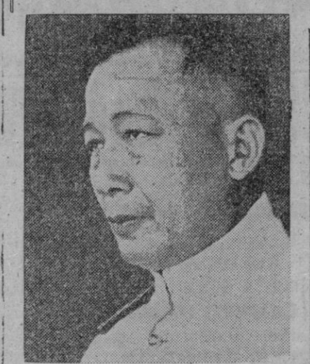
Savang Vatthana, príncipe heredero de Laos, que se ha hecho cargo del trono de su país, sucediendo a su padre el rey Sisavang Vong, gravemente enfermo

Los informes dicen que nutridas fuerzas comunistas atacaron desde el Vietnam del Norte con fuego de artillería de 105 milímetros. Se tiene entendido que las tropas del Gobierno se retiran.