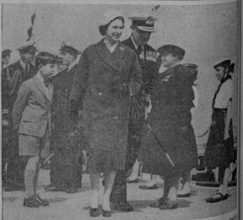
Su Majestad la reina Isabel II y Su Alteza el príncipe de Gales, poco antes de embarcar en el portaviones británico Eagle, recientemente en el puerto de Weymouth. Era la primera visita de la reina a esta ciudad desde que presidió su botadura en Belfast el año 1946.

Durante su estancia en Madrid, el ministro paraguayo firmará convenios entre las dos naciones, y será agasajado por el ministro de Asuntos Exteriores, delegado Nacional de Sindicatos, director del Instituto de Cultura Hispánica, embajador del Paraguay y otras autoridades.