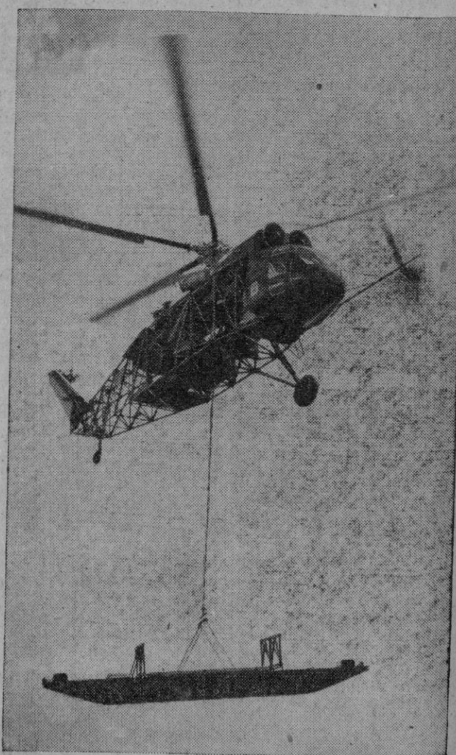
Este helicóptero, que hace una demostración de su capacidad de levantamiento de pesos, es un Westland «Westminster» para trabajos pesados, dedicado actualmente a vuelos de pruebas de motores y del planeador. En esta fotografía levanta una sección de un puente flotante de asfalto, del tipo empleado por el Ejército británico. La sección, que pesa tres mil treinta kilos y mide diez metros y siete centímetros de longitud por seis de ancho, fue levantada y transportada con gran facilidad. La operación se realizó sujetando la sección con una estinga de cable, asegurada a un gancho de desenganche rápido que forma parte del planeador