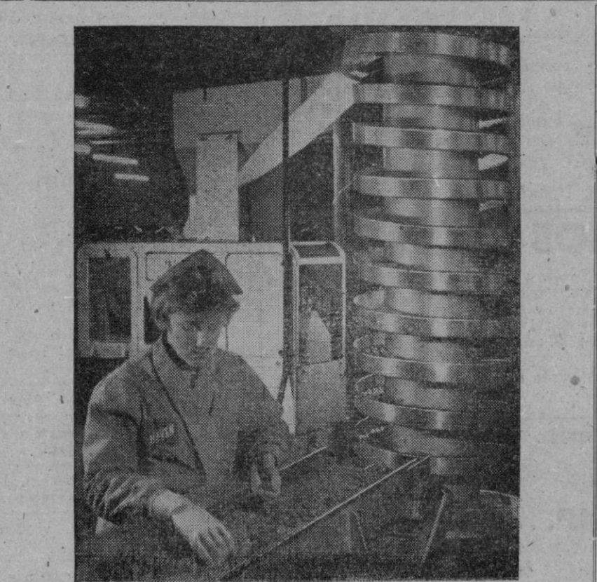
Una firma británica de High Wycombe, utiliza métodos modernos e higiénicos para envasar alimentos; una de las instalaciones que utiliza es este elevador vibratorio de espiral, que proporciona un flujo uniforme para el empaquetado. En esta fotografía se ve a una obrera que abastece almendras de una correa transportadora al elevador, el cual pasa el artículo a una pesadora automática. Los cereales se pasan por tamices y se limpian con aspiradoras al vacío, a fin de extraer todo el polvo, fibras de saco y piedras. La fruta seca se lava y se seca en una de las rotativas más modernas del mundo... y se utilizan electroimanes para extraer clavos y, en general, metales ferrosos que pueden haber caído del envase en que se recibieron. Luego, las cajas de cartón de fruta seca pasan por debajo de un detector electrónico, el cual localiza los metales no ferrosos.

El viaje se ha realizado sin esperar que el monarca vuelva desde su actual visita a los Estados Unidos. Ha sido precisamente esta visita la que ha provocado las críticas públicas a la familia real, las cuales se han venido forjando desde que el ex rey Leopoldo se rindió a los alemanes en 1940.