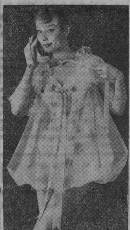
Otro modelo de pijama "bibelot" para verano. Bajo la capita va el pijama propiamente dicho, parecido a un traje de baño, en género de punto de nylon, estampado de rosas. La capita se sujeta al cuello con largas cintas de lazos.

giendo la masa y echándola a la sartén, friéndola, como si fuesen buñuelos de viento.