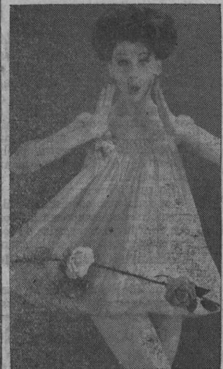
Pijama "abombado" de estilo "bibi-bélot" que para este verano presentan las casas de moda inglesa. Es de tela de nylon de quince deniers, con cuello redondo adornado con gollita

Este problema preocupa también a sus esposas y que no deben contrariarlas, pues el estado de satisfacción y alegría es indispensable para la salud de la futura madre y para el feliz nacimiento del niño.