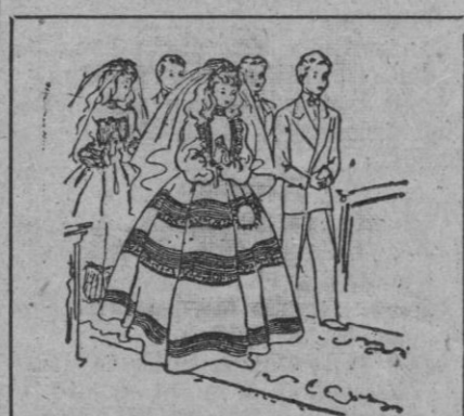
CASA GIVAJA Nuevos modelos Primera Comunión. Especialidad de esta Casa. ULTRALAS

El primer partido, en los campos citados en primer término, se jugarán el día 10 de mayo y los de vuelta, en campo contrario, el día 17 del mismo mes. Estas fechas se respetarán siempre que los citados clubs estén ya exentos de jugar en el torneo Copa de S. E. el Generalísimo.