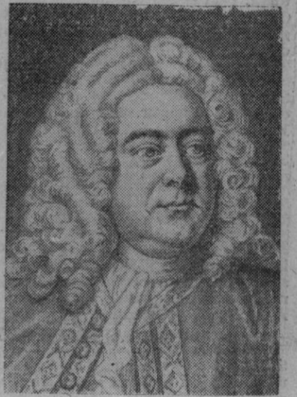
Jorge Federico Haendel, famoso compositor, de cuya muerte se cumple en estos días el 200 aniversario

El «Discoverer II» con un peso de casi 800 kilos, fue lanzado desde esta base el pasado día 13.