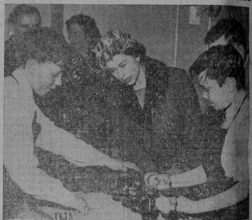
Durante la visita que realizó recientemente la reina Isabel II a la Escuela de St. Michael, en Londres, Su Majestad se detuvo para contemplar el trabajo que efectuaban unos alumnos de catorce años en una maqueta de la locomotora Silver Jubilee, en los talleres de dicha institución.