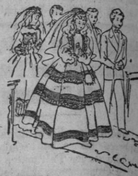
LA CASA GIVAJA. Nuevos modelos. Primera Colección "Especialidad de esta Casa". ULTRALAS