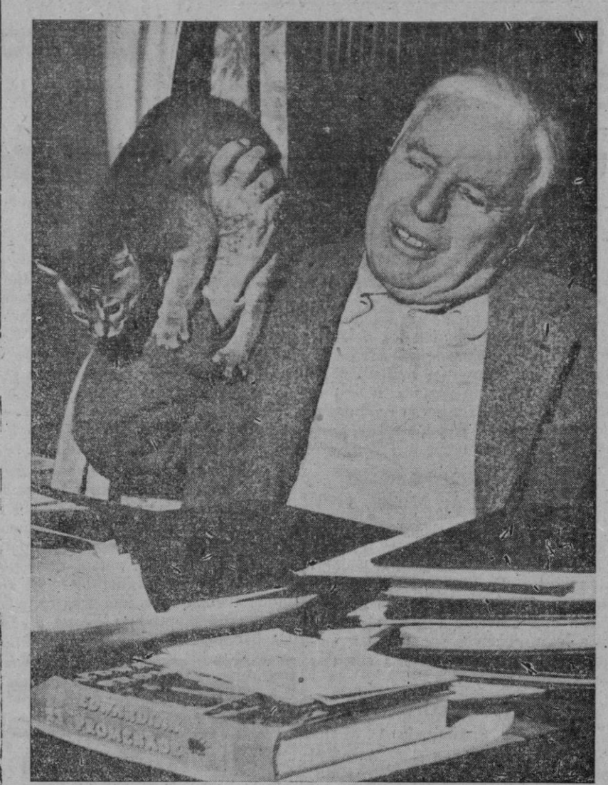
Charlie Chaplin emplea ocho horas diarias en trabajar en sus memorias, aunque siempre encuentra tiempo para jugar un poco con el gato siamés Monkey

tema: «¿Es este el momento apropiado para revelar un secreto...?»