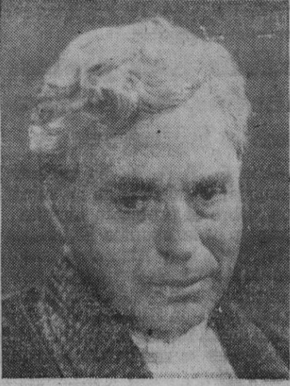
lento natural y su crítica es siempre constructiva. Ha leído muchísimo y tiene por tanto una gran base de juicio.»

Marbella (Málaga). 2.—Los artistas Diana Dors y Peter Lorre se encuentran en Marbella rodando escenas de la película «Esencia de misterio», en el hotel El Fuerte, sobre el que se han levantado grandes andamios y decorados. El productor de este film es Mike Todd.—Cifra.