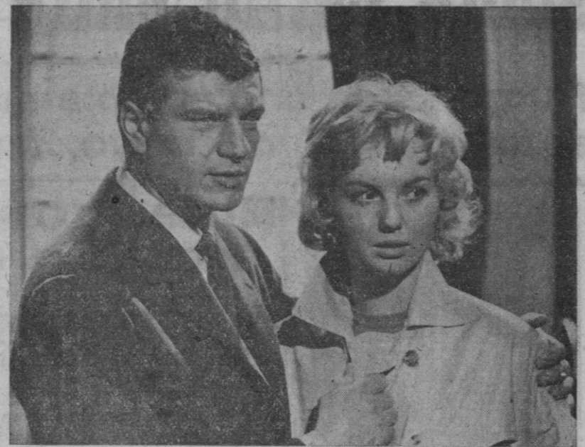
Bajo la dirección de Marc Allégret, se realizó el "rodaje" del film francés "Sois belle et tais-toi", que lleva como protagonistas a los famosos Henry Vidal y Mylène Demongeot, quienes aparecen en el grabado en una escena de la película