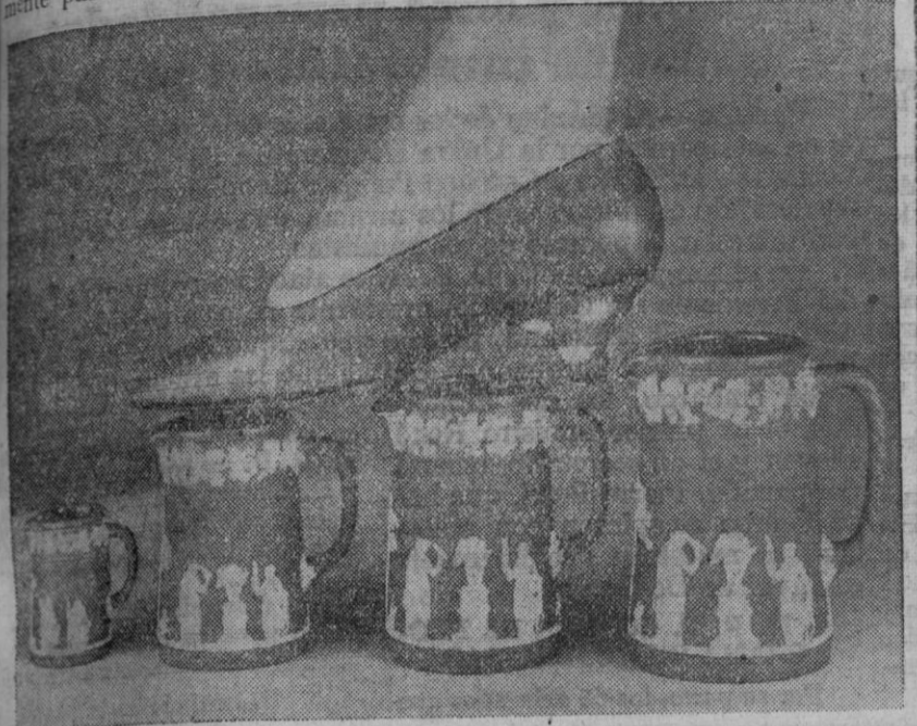
Este zapato, cuyo tacón es una reproducción de las famosas obras de cerámica "Wedgwood", se mostrará en la Exposición del Calzado, de 1959, que se celebrará en Harrogate, Inglaterra, durante tres días, a partir del 7 de Abril. Los tacones, con diseños tradicionales Wedgwood, son de azul verde, los adornos, estilo camafeo, son de colores verde y negro.

La Iglesia recomienda la edad acostumbrada en cada región. En qué edad se pueden comenzar las relaciones amorosas? Los moralistas aconsejan que no se comiencen antes de dos o tres años de estar en condiciones para casarse. Las relaciones cortas no sirven para conocerse. Los enamorados antes de dar un paso tan trascendental en la vida, y las demasiado largas corren el riesgo de cortarse definitivamente en cualquiera de los constantes enfados de la pareja, con perjuicio especial para la mujer.