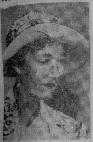
La gran duquesa Carlota de Luxemburgo que el pasado día 23 de los corrientes ha cumplido a la vez los sesenta y tres años de edad y los cuarenta de su reinado

El señor Vigón marchó por último al pantano del Chorro, donde almorzó, y por la tarde recorrerá toda la zona del Guadalquivir, para determinar la zona de regadío y zona de canalización.—Cifra.