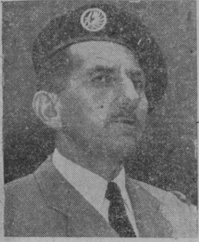
Jacques Massu, general de las fuerzas francesas de paracaidistas, famoso por el golpe de Argelia, en Mayo, nombrado prefecto en aquel territorio por el general De Gaulle

8,50 pesetas en lugar de 10, por cada cien francos