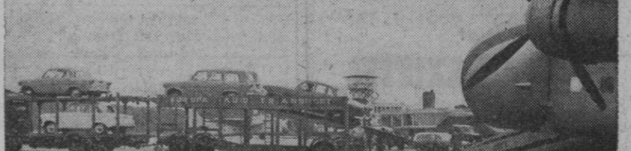
Esta fotografía muestra el transbordo de automóviles en el aeropuerto de Le Touquet, París, desde un avión a un enorme vehículo de transporte carretero que los llevará a Amberes, Bélgica