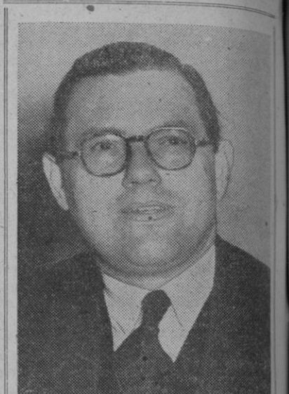
Reginald Maudling, ministro inglés de Asuntos Europeos, que preside las negociaciones relativas a la Zona de Libre Comercio en Europa