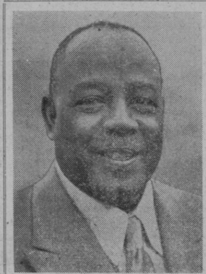
El general Ibrahim Abbud, comandante en jefe del Ejército sudanés, que se ha hecho cargo del poder en dicho país, en un golpe de estado, sin derramamiento de sangre

España-dijo-no puede guardar silencio en relación con el continuado dominio británico del Peñón