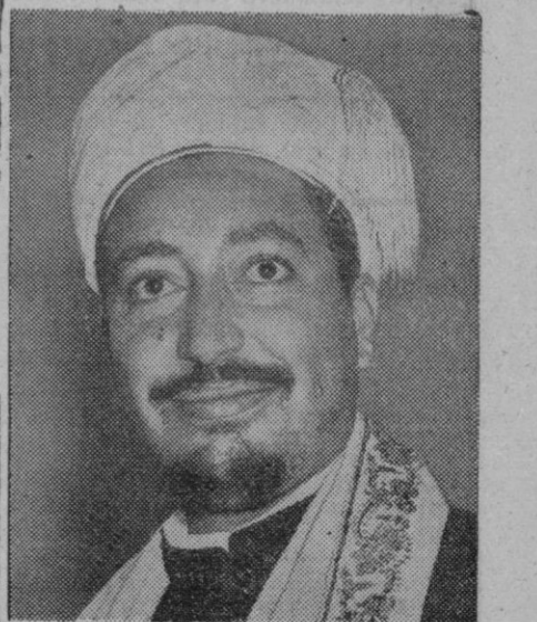
Mohamed El Badr, príncipe heredero del Yemen, que trató, en las recientes conversaciones de El Cairo, de la unión de su país a la República Árabe Unida, unión que se hará oficial tras el plebiscito de hoy, 21

Al terminar el debate en los Comunes, Mac Millan declaró que desea que se celebre la Conferencia, pero rechaza las insistentes demandas laboristas para que fije una fecha. «No puedo adoptar tal medida, unilateralmente», dijo.—Efe.