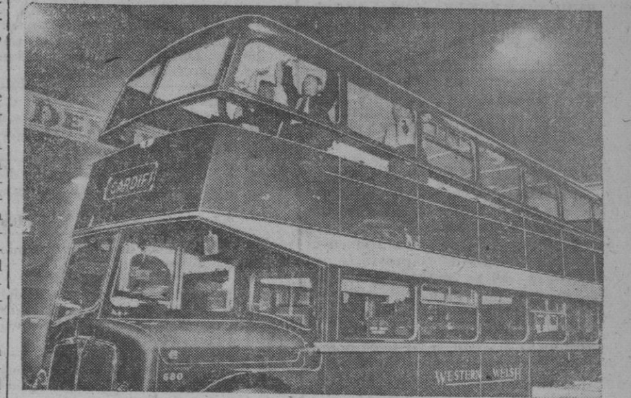
Autobús inglés de dos pisos, con techo de fibra de cristal, que es totalmente desmontable. En la fotografía, cuatro hombres levantan dicho techo del resto de la carrocería. En buen tiempo, los pasajeros del piso alto pueden disfrutar del aire puro.