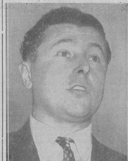
Pierre Poujade, político francés que está combatiendo el pago de impuestos como se practica en la actualidad en su país, y que ha dado la campaña en las recientes elecciones en Francia

Es probable que la petición de Poujade de que se anulen las elecciones sea rechazada. Sin embargo, insiste en su amenaza de provocar «fuegos artificiales» en Francia.—Efe.