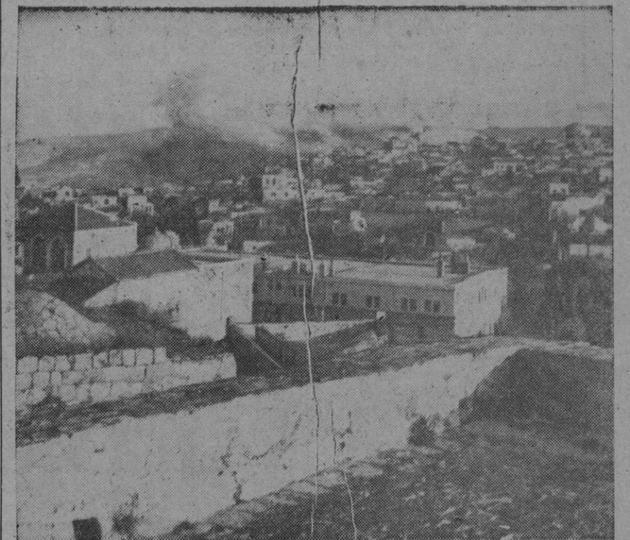
Un aspecto de la vieja ciudad de Jerusalén, escenario tantas veces de las luchas entre árabes y judíos. La situación tensa entre ambos pueblos en la zona de Gaza, pudiera llevar otra vez el fragor del combate hasta la más preciada reliquia de toda la Cristiandad, si la paz no llega a resolver el crítico momento.

SIRIA y JORDANIA permanecen alerta en toda la frontera con Israel