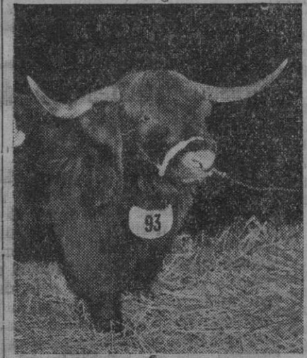
Otro raro ejemplar bovino, un novillo de la raza Highland, que por lo visto ha logrado varios premios en diversos concursos

Nosotros creemos que en este sentido se exagera, aunque parezca que está justificado tanto pesimismo. Nos parece que si esas precipitaciones que han empezado a producirse enlazan con otras y se restablece el tiempo normal de aquellas latitudes, otoñada tendrán todavía, y por lo menos, como decíamos la semana última, el