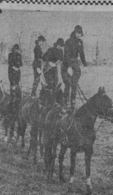
Ya sabemos que también hay muy buenos jinetes del sexo femenino. Y por si acaso alguno de ustedes lo dudara, aquí les ofrecemos una muestra de lo que decimos. Estas amazonas lucen una habilidad y destreza extraordinarias, que ya quisieron para si muchos. Nosotros, desde luego, los primeros.

El tiroteo empezó cuando el bajá El Glaui fué objeto de un atentado al salir de la residencia de Grandval. La escolta repelió la agresión y resultaron numerosos heridos. Las manifestaciones se prolongaron durante todo el día. Sólo se restableció la calma a las cinco de la tarde.