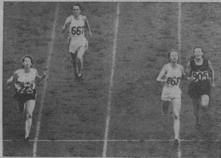
La dificultad que surge de vez en cuando en algunas carreras en el crítico instante de la llegada se ve bien clara y patente en el grabado que presentamos. Esas dos atletas que pisan la cinta de llegada al tiempo, darán origen a discusiones. Sin embargo, no creemos que dé mucho que pensar la llegada de 'aquella de allá lejos'.

Madrid, 22.—Anuncia el Instituto Nacional de la Vivienda un concurso de prototipos de viviendas de renta limitada entre los arquitectos españoles, para las zonas de Cantabria y Galicia, que comprende las cuatro provincias gallegas, Asturias, Santander, Vizcaya y Guipúzcoa, así como las zonas de influencia inmediata con características climatológicas análogas; zona de la alta meseta de Castilla, alto Aragón, Castilla la Nueva, bajo valle del Ebro, Cataluña, y Baleares, Extremadura, La Mancha y alta Andalucía, zona levantina, baja Andalucía y Canarias.