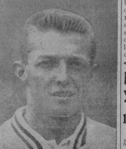
Tony Trabert, la estrella del tenis americano, vencedor del torneo de Wimbledon, que ha rehusado convertirse en profesional por causa de las grandes cargas fiscales que ello le reportaría.