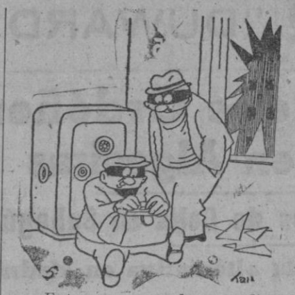
—Entonces, ¿no hay medio de abrir el maletín de las herramientas?

Una vez nacida la lechigada de lechoncitos, se les marca en la oreja para su identificación en el futuro—cosa importante para conocer la fecha de nacimiento de los animales que se usan con el fin de hacer experimentos de alimentación—y se les deja con la madre hasta que tienen siete días. Después, se les lleva al establo especial para ellos.