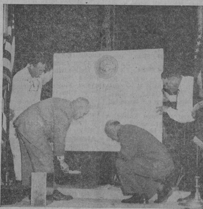
George Meany (izquierda), presidente de la Federación Americana del Trabajo, y el presidente Eisenhower empuñan llanas al colocar la primera piedra del nuevo edificio de la Federación en Washington. Albergará a la Federación Americana del Trabajo y al Congreso de Organizaciones Industriales. Unos obreros sujetan la piedra, que cuelga de una cadena

La ceremonia religiosa se llevó a cabo en el más completo orden, y aun cuando no había instalación de altavoces para la gran muchedumbre concentrada en el exterior pudiese seguir la función religiosa, los católicos guardaron un respetuoso silencio.