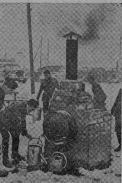
Quizás pueda servir esto de una buena idea para las amas de casa que no tienen termo en su cocina. Unos ladrillos, un bidón de los de aceite, una chimenea, un poco de leña y... ¡agua caliente!

Londres, 6 (4 t.).—Se espera que el matrimonio Churchill salga de la