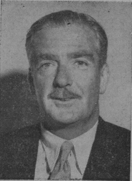
El muy honorable sir Anthony Eden, encargado por la Reina Isabel II de formar nuevo Gobierno