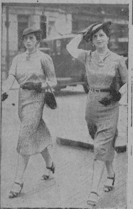
Las señoras van de compras, o de paseo. ¿Quién sabe? La de la derecha ha visto a alguna amiga en un balcón y surge el adiós espontáneo, que por esta vez no se enredará en una larga y pesada conversación como acostumbra.

aprobado anoche por 287 votos contra 256.