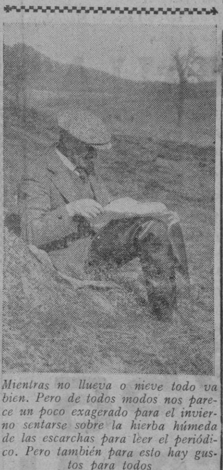
Mientras no llueva o nieve todo va bien. Pero de todos modos nos parece un poco exagerado para el invierno sentirse sobre la hierba húmeda de las escarchas para leer el periódico. Pero también para esto hay gustos para todos

Agrado y satisfacción Roma, 31 (4 t.).—Un portavoz del ministerio de Asuntos Exteriores ha manifestado que Italia acogió con agrado y profunda satisfacción la aprobación por la Asamblea nacional francesa del rearme alemán.—Efe.