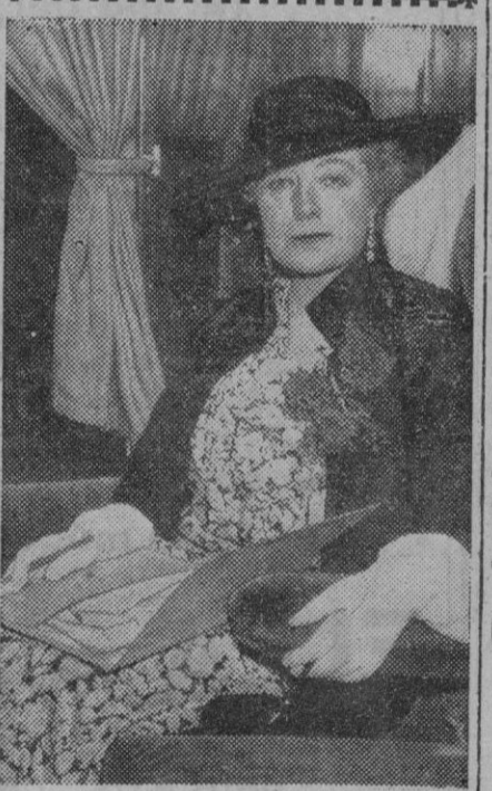
La señora no es que se haya querido lucir con ese traje tan fuera de la época y de la moda. ¡Cada uno tiene sus gustos! Lo que sucede es que se trata de alguna famosa secretaria con su cartera de documentos y todo. ¡Otras llevan bolsos!

«Muchas de estas dificultades son restos del trágico pasado. Confiamos que ese pasado se dará por terminado definitivamente».