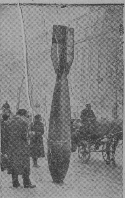
Ignoramos el motivo de esta exposición al aire libre, en medio de los transeúntes, que por otra parte no parece llamarles mucho la atención el destructor artefacto. Quizás un simple toque de atención y de recuerdo a lo que representa la guerra en todos los aspectos... Con todo, las naciones siguen armándose hasta los dientes sin saber ya hasta qué punto se evitará así o se den mayores motivos para provocarla

Madrid, 22.—Por la Dirección General de Turismo, ha sido impuesta la multa de 5.000 pesetas al Hotel Nacional, de Tarragona, por dedicarse a actividades inmorales.—Cifra.