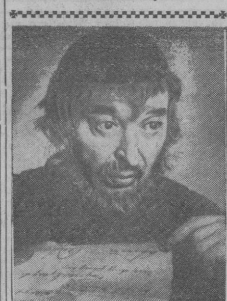
Si les decimos que este señor es el alemán W. Krausse, es natural que muchos se queden como antes de saberlo. Pero si les aseguramos que es el autor de "El mercader de Venecia", ya es otra cosa, ¿verdad? Pues él es. ¿Le conocen?

Hanoi, 2 (urgente).—Las vanguardias comunistas se encuentran a menos de mil metros del centro de la fortaleza de Dien Bien Fu. Se ha llegado a la lucha cuerpo a cuerpo y la situación para la guarnición francesa es muy difícil.—Efe.