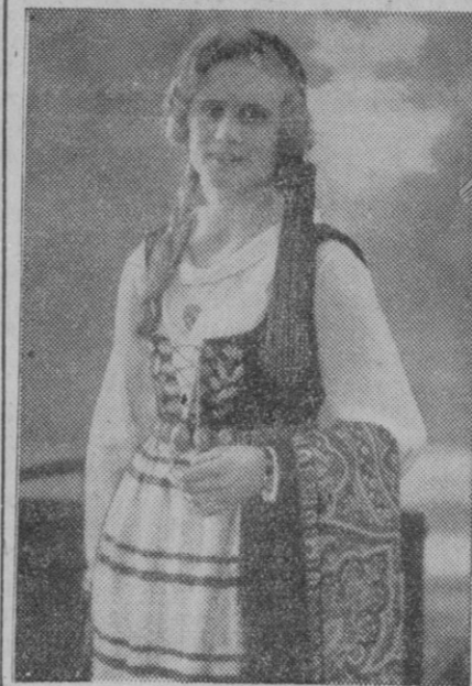
La belleza femenina no es una exclusiva de ningún país. En todos ellos abunda. En unos, más. En otros, menos. Pero todos pueden dar buenas muestras de ella. Islandia nos presenta también esta linda muchacha alaviada con el traje regional de su país que realiza más aún la gracia de los países nórdicos.

RUSIA pretende introducir desunión entre las potencias occidentales