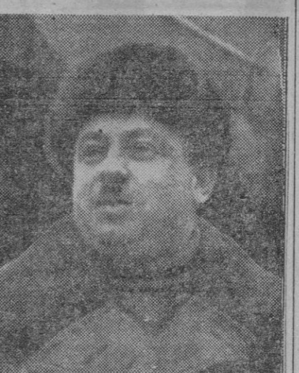
AGASAJO A SHAO YU-LING

Ottawa, 28.—La protesta española por la proyectada visita de la Rei-