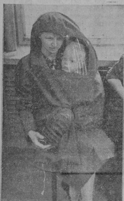
Esta señora luce un extraño abrigo. Extraño porque no es para ella sola, sino que sirve para cubrir también a su pequeño. Se utiliza contra los gases y lleva una mirilla que hace perfecta la visión, así como un dispositivo especial que permite respirar el aire, al que limpia de los gases intoxicantes.

El secretario de la Asamblea, señor Tena, hizo historia de la U. N. E. S. C. O., desde su creación, para sustituir al Comité de Cooperación Intelectual de la extinguida Sociedad de las Naciones, cuya misión es asegurar amplias e iguales oportunidades para la educación y la investigación sin restricciones para la verdad objetiva