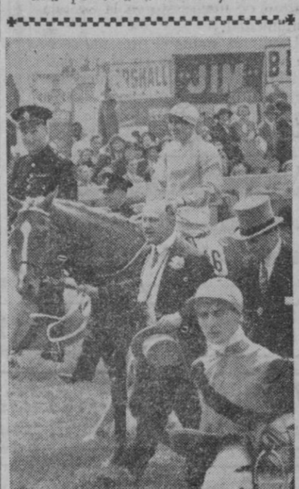
El propietario—ese señor del frac, la chistera en la mano y el clavel blanco en la solapa—, el «jockey»—el que va montado— y hasta el caballo—el que va debajo, con cara alargada—, están satisfechos. Y lo están porque el cuadrúpedo acaba de triunfar en la carrera y unos miles de libras ingresarán en la caja fuerte del elegante propietario.

En este acto de clausura de los II Consejos regional y nacional de Prensa, el ministro de Información y Turismo, don Gabriel Arias Salgado, pronunció un interesante discurso en el que, después de hacer historia de la Prensa española y rebatir la concepción liberalista de la libertad de Prensa, concepto que queda desplazado de la doctrina social del Movimiento, desarrolló la idea de nuestra «Prensa orientada», como una perfecta armonía y correla-