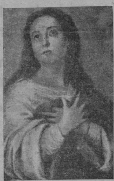
Coincidiendo con la festividad de la Inmaculada Concepción, Patrona de España, S. S. el Papa Pío XII, proclama al mundo desde la basílica romana de Santa María la Mayor, la apertura del Año Mariano, en conmemoración del I Centenario de la proclamación del Dogma de la Inmaculada, que coincidirá con el 8 de Diciembre del próximo 1954.

También se celebraron anoche diversos actos preparativos del Año Mariano en las restantes ciudades españolas que hoy honrarán a la Inmaculada Concepción.