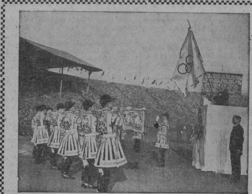
En Inglaterra son muy amantes de la tradición. En cuanto surge una ceremonia de vital importancia el atuendo clásico sale a relucir. Como sucedió, por ejemplo, en la clausura de unos Juegos Olímpicos que se celebraron en Londres. La banda de música, con sus alabios lujosos, lanza al aire la sonoridad argentina de sus clarines. Y esto... (la Olimpiada y el comentario) se acabó.