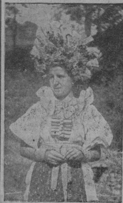
Este rico y recargado traje que viste esta joven, adornada su cabeza con multitud de avalorios, es el atuendo típico del país gallego.