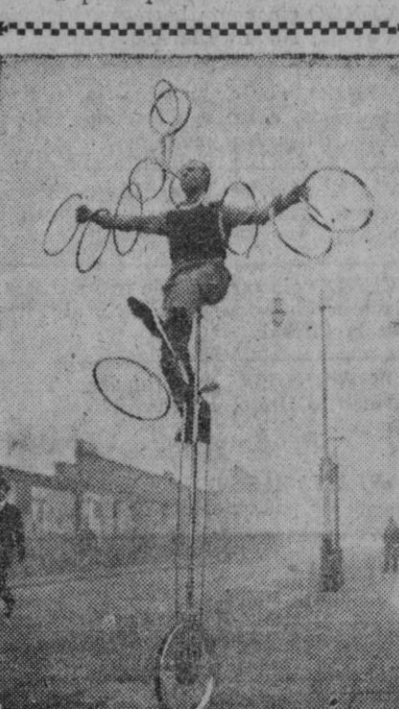
En el circo siempre hay alguna novedad. Arriegada o no, pero que cuenta con el beneplácito del público. Pero no sólo bajo los toldos se hacen los grandes números circenses. Por ejemplo, este señor ha preferido hacer su exhibición en plena calle, luciendo en un alarde de equilibrio y precisión, al tiempo, en el difícil juego de los aros.

Como se puede apreciar de estas cifras provisionales, la producción para alimentación humana ha sido más larga que la que se destina para piensos.—Cifra.