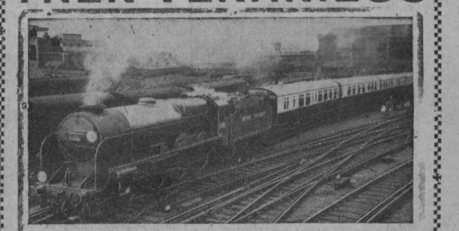
La fotografía de este tren puede servir a algunos—los que vayan a gozar de vacaciones un poco atrasadas—de estímulo, pensando que de un día a otro tendrán que encaramarse al estribo. Sin embargo, los que ahora estén gozando plenamente de las delicias veraniegas, al ver el grabado experimentarán una sensación de agobio. Porque, ¿quieren que no, el trenecito en cuestión es una invitación para el regreso. ¿Con qué rabia le mirarán algunos!