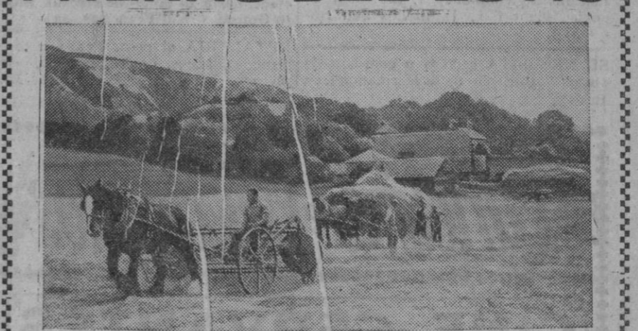
Y todos los años, a no detrás de otro, la escena se repite. El montón de paja, las máquinas aventadoras o los trillos sobre la parva, el botijo a la sombra de un haz, y adelante con la faena, sin desmayar, hasta la caída del sol. Los rostros morenos, sudorosos; el torso agachándose y levantándose, todo como una máquina primitiva que, en el mañana, podía saborear el rico pan que ha forjado con su esfuerzo.