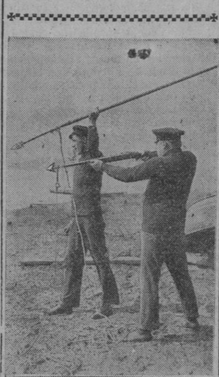
Esto, amigos, es una escopeta con arpón, que se puede utilizar para la caza de tiburones, peces espadas, ballenas pequeñas y otros ejemplares marinos que no excedan el tamaño de los citados. Claro que, si la pesca con caña es pesada, aun para los buenos aficionados, imagínense lo que sería estar junto al Eresma esperando la arribada de un tiburoncete para practicar con esta hermosa escopeta!

▲ Sin ellas, opina que sería difícil tratar de la disputa petrolífera