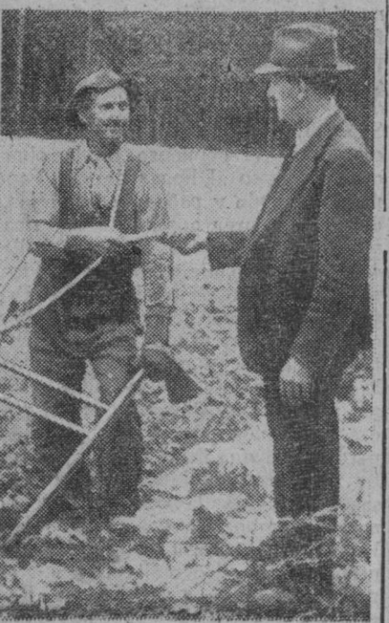
El hombre del campo y el hombre de la ciudad podría titularse este grabado.

Pero, bien mirado, lo que de verdad encierra es una demostración de perfecta hermandad entre estos dos hombres que representan al campo y la ciudad, tan necesaria para la buena marcha de una nación.