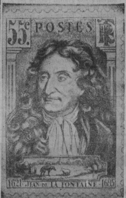
Esa larguísima melena rizada, que circunda el rostro del caballero del pañuelo al cuello, pertenece—como el rostro y el pañuelo—al famoso fabulista francés Juan de la Fontaine. Figuró este grabado en unos sellos que la Administración de Correos de Francia puso en circulación hace algunos años, tributando así un homenaje al celeberrimo autor de fábulas.

Otros dos barcos norteamericanos—los buques de instrucción del Servicio de Guardacostas «Eagle» y «Rockaway»—tocarán en el puerto de La Coruña hoy, día 21, y mañana, y zarparán luego para Las Palmas, donde llegarán el 2 de Agosto, permaneciendo allí hasta el 5 de dicho mes. Ninguno presentaba heridas apa-