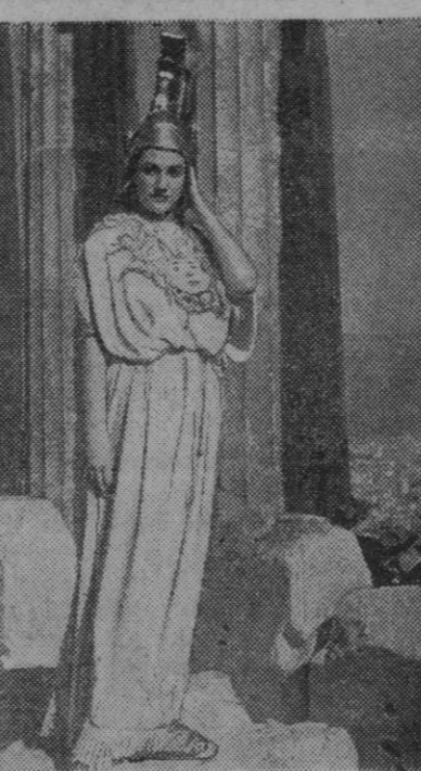
Sobre las magníficas columnas dóricas del Partenón, en la acrópolis de Atenas, ven ustedes la figura de esa joven griega que, con el "peplos" bordado y el yelmo de bronce, semeja otra Minerva.