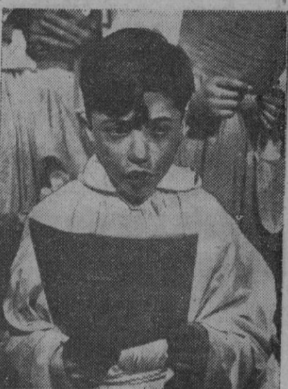
Este pequeño cantor de una catedral francesa mira atentamente al director del coro, mientras canta en una función religiosa. Posiblemente dentro de muchos años se convertirá en un gran cantante, si la voz y la fuerza de voluntad para el estudio le acompañan.