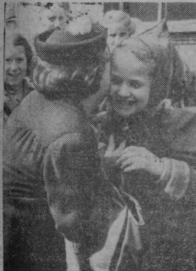
Esta es una escena que no tiene nada de particular. Simplemente que una madre abraza a su hijita que la espera a la llegada de un largo viaje. Pero a pesar de todo es una escena que resulta evocadora y que siempre interesa por su ternura.