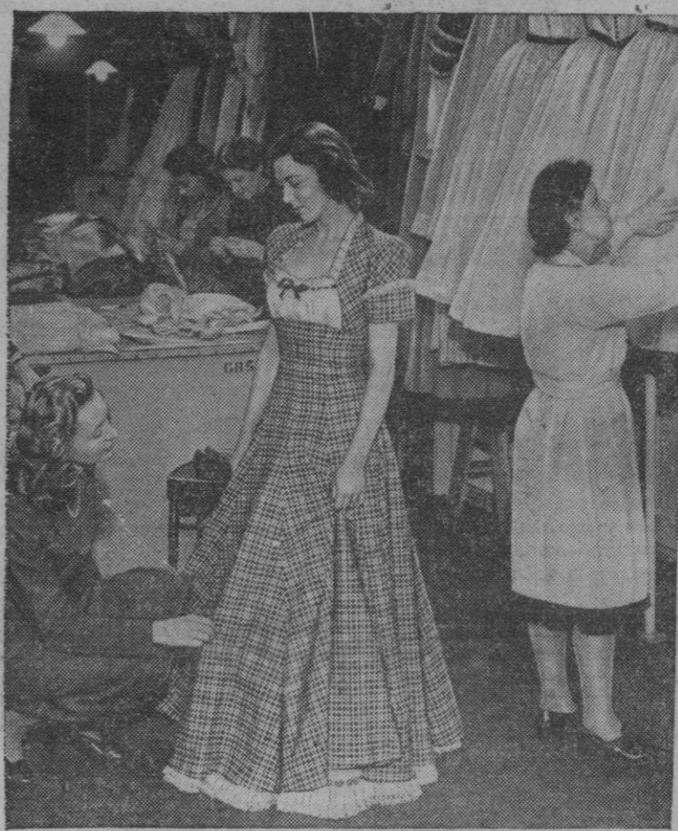
Este es el mundo que tanta gente desea conocer por lo atrayente que le resulta. Se trata de un camerino de una artista, que es tanto como decir la vida íntima del teatro con sus sinsabores y sus alegrías.