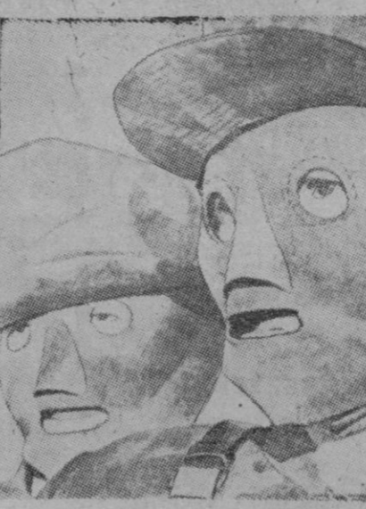
Carnaval se acerca. En España ha desaparecido esa costumbre, pero en algunos sitios se celebra cada año con más interés. En la foto vemos dos máscaras diseñadas para su inmediata construcción que ocultaran la verdadera faz de quien las utilizase y le facilitaron, por tanto, el camino para una serie de cosas que no se atrevería a hacer con la cara desnuda.