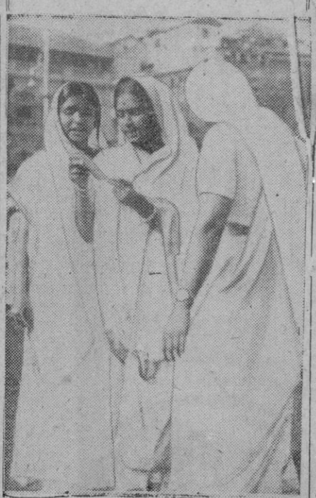
La política no es algo exclusiva de los hombres como la moda no lo es de las mujeres. Precisamente en la fotografía que reproducimos aparecen unas mujeres indias que esperan la entrada en una asamblea política discutiendo los problemas que han de presentar.