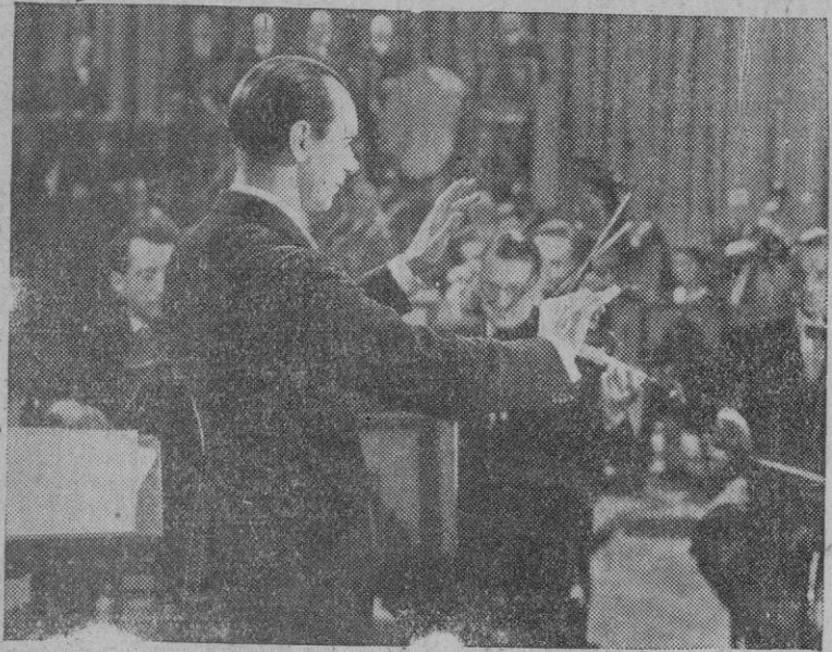
Malcom Sargent, destacado director británico, dirigiendo la "London Symphony Orchestra", tal y como aparece en una de las escenas de la película inglesa en que se exhiben todos los instrumentos de que una orquesta se compone.