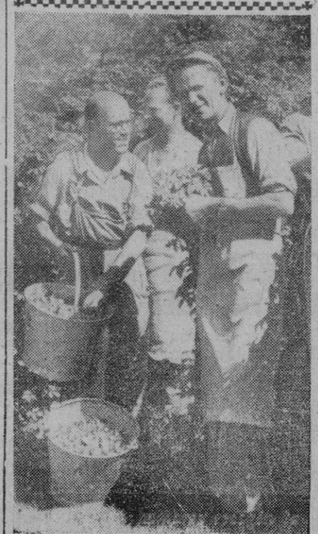
Estos dos hombres recogen la manzana en Copenhague y muestran su satisfacción por lo abundante de la cosecha. Este fruto es característico de esta región y de ella salen grandes cajas para otras regiones.

Entre los asuntos tratados, aparte de los de trámite, figura el nombramiento de una comisión encargada de seleccionar el fallo del concurso de trabajos y estudios presentados por aficionados y técnicos para evitar la caída de los toros. A primera hora de la tarde suspendieron la reunión para entrevistarse con el director general de Seguridad a fin de darle cuenta de algunos de los acuerdos adoptados, tales como el de que se exija el peso reglamentario de los petos; que se prohíba el «afeitado» de los toros, solicitando se castigue esta anomalía con la máxima severidad, y presentarle, por último, los distintos modelos de puyas, a fin de sustituir, la que se juzgue más eficaz, a las que actualmente se emplean.—Cifra.