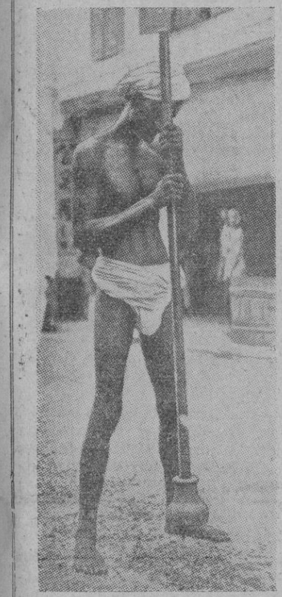
Esta estampa de una calle de Ceilán es típica. El obrero, desnudo, soportando el clima tropical, trabaja en la pavimentación de una calle.