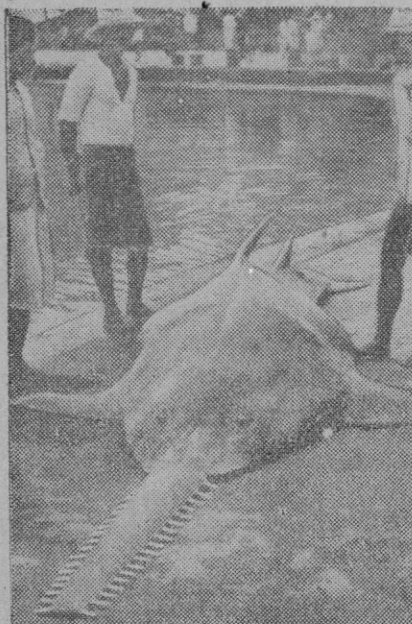
He aquí un pez sierra capturado en las costas de Insulindia, que son muy ricas en especies raras. El pez sierra pertenece a la familia de la raya y este ejemplar, de los mejores de su especie, mide cinco metros de largo.