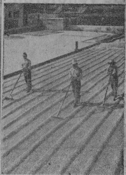
Los tres obreros marchan por entre esa especie de surcos que parecen de un sembrado. Pero su labor es muy distinta a la imaginable por las apariencias. Se trata de un secadero de café en Guatemala y la labor de los operarios se limita a darle la vuelta para que el sol lo seque por igual.