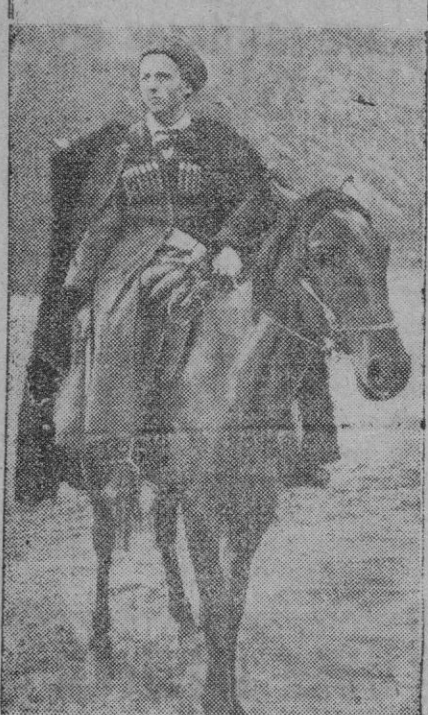
Este es el último vestigio del tipo de cosaco que ha persistido hasta última hora en la lucha contra el comunismo. Y aun, después de la derrota alemana, se conservan algunos gankis refugiados en el sector yupki de Alemania.