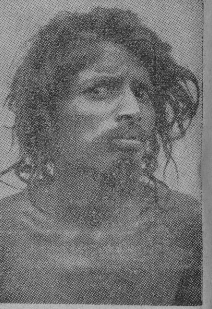
La población de la India se compone de una mezcla de razas que hace muy difícil averiguar el verdadero origen de un habitante cualquiera. Este tipo es el clásico hombre desprovisto de absoluto de su porte físico. En esto también es pródiga la India.