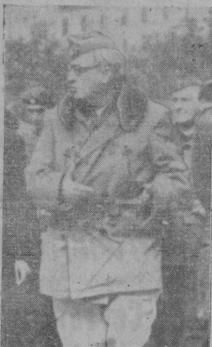
Estas fotografías recogen al heroico militar en plena Cruzada de liberación. Con la muerte del general Yagüe España ha perdido uno de sus militares más gloriosos, cuyo talento estuvo siempre al servicio de la Patria.

El 17 de Julio de 1937, ya coronel, es nombrado jefe del primer Cuerpo de Ejército de Madrid. En Noviembre del mismo año asciende a general de brigada. Al frente de sus tropas toma parte en todas las acciones ofensivas y defensivas que se libran en las inmediaciones de Madrid. Al reorganizarse el Ejército de maniobras, para emprender las grandes ofensivas de Aragón, asume el mando del Cuerpo de Ejército marroquí. Interviene en Belchite, paso del Ebro por Pija, paso del Cinza y conquista de Fraga, Alcaraz y Lérida. Interviene luego en la liberación de