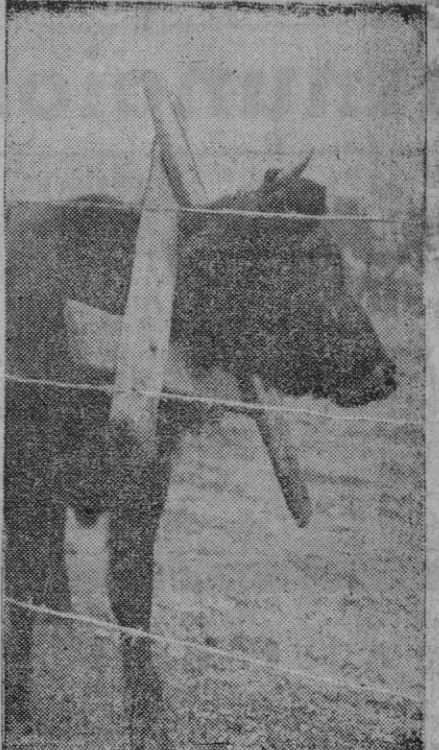
La potencia de este toro es muy superior a la resistencia de una sogá. Para que no se saiga del cercado donde le han puesto, ha sido preciso rodearle el cuello con un collar de madera. La seguridad está garantizada pero en parte nada más porque, dispuesto a marcharse, es muy posible que lo hiciera con anillo y todo.