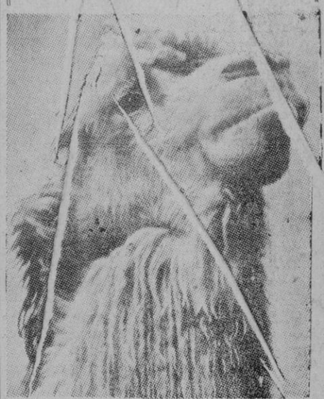
Este orgulloso camello, con la cabeza bien alta, es el guía de una caravana que cruza dos veces al año el desierto. Tal vez sea este el motivo del orgullo con que se muestra.

alto comisario de España en Marruecos y actual director de la Escuela Superior del Ejército.