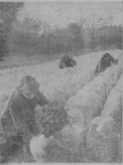
El invernadero común sustituye a esta serie de campanas de cristal, que son el invernadero particular de cada planta y que se preparan ya para la próxima temporada de frío.

«Incluso entre los partidos burgueses—agregó—la política del Gobierno Yoshida encuentra creciente oposición. La maniobra de elecciones súbitamente ha sido calculada para preservar la continuidad de la actual política, mediante la constitución de una especie de Gabinete de coalición. Hace tiempo que venían celebrándose negociaciones entre bastidores a este respecto.»—Efe.