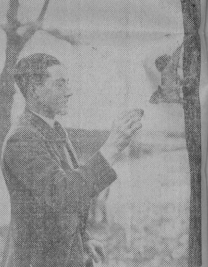
La ardilla es uno de los animales más vivos y más ágiles. En este momento que recoge el grabado, se inclina hacia la mano del hombre que intenta enganar la para cogerla. ¿Qué ocurrirá? Seguramente el animal vuelve a trepar.