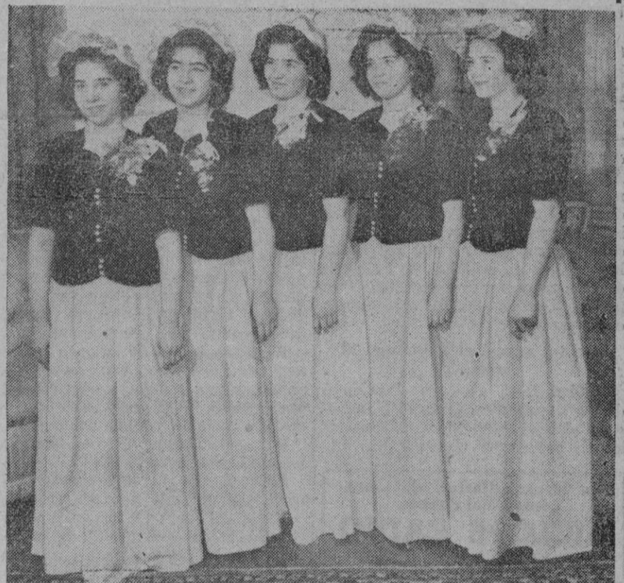
Estas cinco gemelas canadienses que cumplieron en Mayo 18 años, continúan teniendo la exclusiva, en compañía de las Dione, de grupos de cinco gemelas. Ayer estuvieron a punto de perderla. Pero hoy... murieron ya dos de las recién nacidas en Sao Paulo.