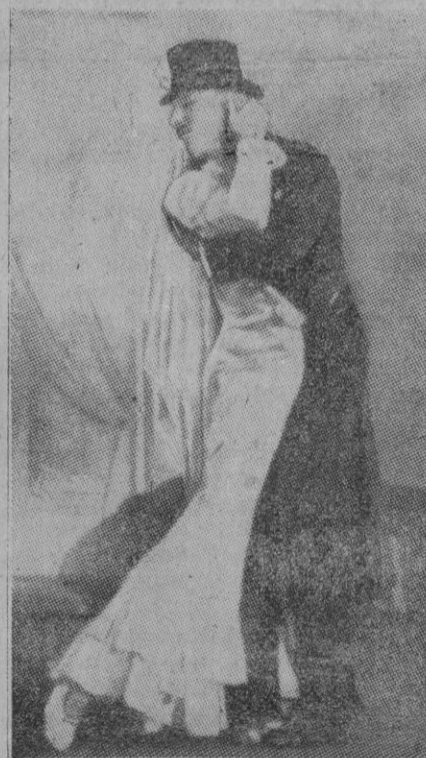
Esta pareja de formidables bailarines no es una pareja. Por mucho que parezca que lo es, podemos asegurarles que se trata de una sola bailarina que simula perfectamente danzar acompañada.

Bagdad, 22 (4 t).—El ministro de Asuntos Exteriores, Dr. Dhil Jamali, ha advertido que el mundo árabe perderá su fe en Occidente a menos que las grandes potencias pongan sobre el tapete de la Asamblea General de las Naciones Unidas las cuestiones de Túnez y Marruecos. «Si estas cuestiones norteafricanas no van a la Asamblea General como piden los países asiáticos y árabes, la Liga Árabe pondrá en duda la sinceridad de las grandes potencias a favor de la liberación y de la autodeterminación», ha dicho a los periodistas. «Por nuestra acción—añadió—estamos ayudando a Francia a realizar los objetivos de la revolución francesa y aplicarlos a las naciones de África del Norte. Las relaciones árabes, islámicas y asiáticas con Francia dependen de lo que ésta haga ahora.»—Efe.