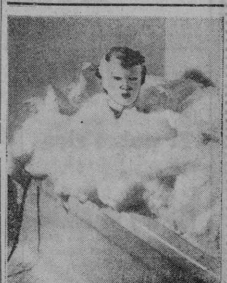
Esta extra6a cosa que representa la foto y que a simple vista no se distingue, es una nube. En la nube asoma la cabeza una se6ora. Porque es que la nube es de espuma y la se6ora con este ba6o pretende que el cutis de la cara represente lo que ya no puede representar, el pobre, sin espuma.

El ministro sali6 poco despu6s, en autom6vil, con direcci6n a Mar6n, donde pasar6 una breve temporada de descanso.—Cifra.