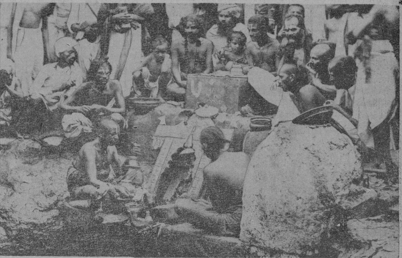
La India, sin duda el país más enigmático y misterioso, conserva sus ritos tradicionales como en los tiempos más remotos.

Río de Janeiro, 19.—Ha llegado a Río de Janeiro la delegación médica (Continúa en la página 3)