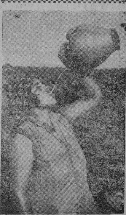
Esta señora, que parece húngara o gitana o algo así, es francesa. El botijo, en cambio, que es español, se nota que es botijo con un simple vistazo.

Hallinan, abogado de San Francisco, ha cursado su petición en un cable a la Casa Blanca.—Efe.