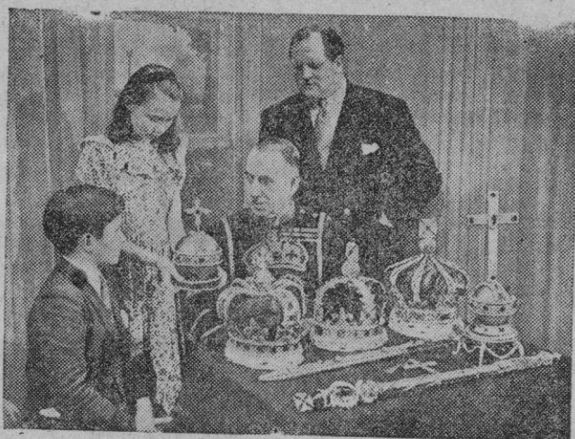
Copias de las joyas de la Corona, preparadas exclusivamente para que los canadienses y otros pueblos de América pudieran contemplar tesoro de valor tan elevado

Se utilizarán en los funerales de Jorge VI