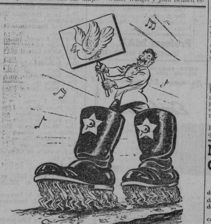
En esta caricatura norteamericana aparece Stalin empujando un cartel con la paloma de la paz y oprimiendo a las masas rusas

RUSIA SE OPONE AL INGRESO DE ITALIA EN LA O. N. U. Paris, 18. (Urgente).—La Unión Soviética se ha opuesto a la admisión de Italia en la O. N. U., mientras no sean admitidos otros trece países.—Efe.