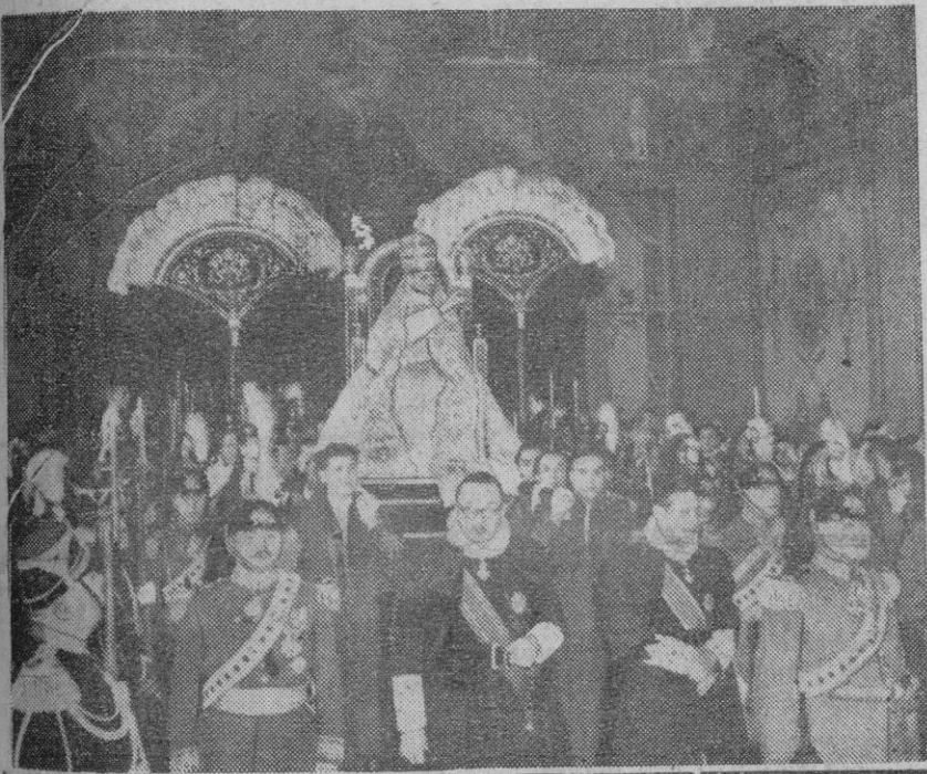
Su Santidad el Papa Pío XII, en la silla gestatoria, desde la cual dió ayer la bendición a la inmensa multitud apiñada en la plaza de San Pedro, con motivo de la proclamación del dogma de la Asunción

Ciudad del Vaticano, 1. (Servicio especial de la agencia Logos).—Su Santidad el Papa, en el instante de la proclamación del dogma de la Asunción de Nuestra Señora, pronunció textualmente las siguientes palabras: «Pronunciamos, declaramos y definimos ser un dogma revelado que la Inmaculada Madre de Dios, siempre Virgen María, consumado el paso de su vida terrena, fué asumida en cuerpo y alma a la Gloria Celeste.»