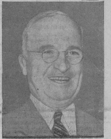
El Presidente Truman