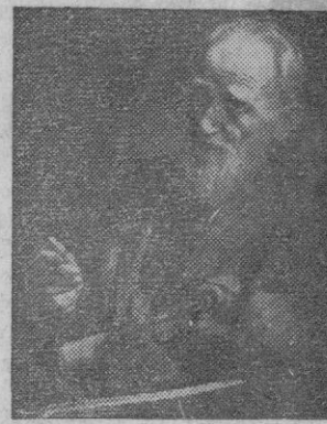
George Bernard Shaw, que acaba de fallecer a los 94 años de edad

Ayot Saint Lawrence (Inglaterra), 2 (1 t.).—A las seis menos un minuto, ha fallecido hoy George Bernard Shaw.—Efe.