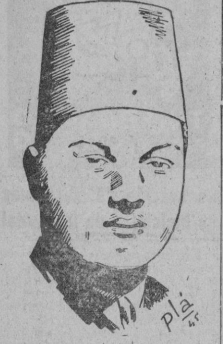
El Rey Faruk de Egipto

Londres, 16.—El «Sunday Pictorial» dice que el Rey Faruk de Egipto contrajo matrimonio en secreto el pasado mes de Mayo con Narriman Sadek. Agrega la información que la ceremonia se efectuó de acuerdo con el rito «biktash», secta que si bien no está reconocida oficialmente por los musulmanes, goza de la protección especial de la Casa Real egipcia.—Efe.